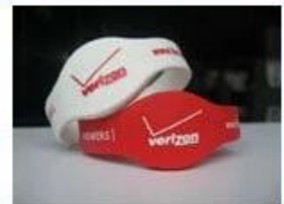
4.Silicone Wristbands (Full Sealed Type)