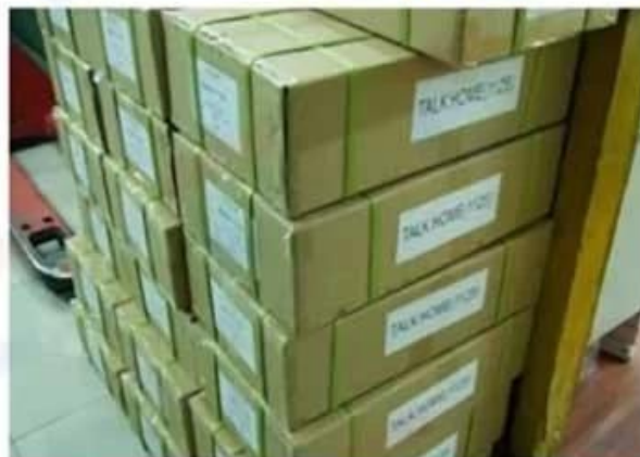
Outside Carton Package