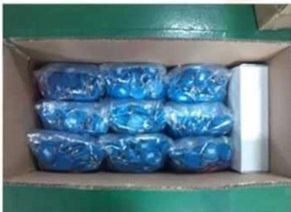
Inner Carton Package