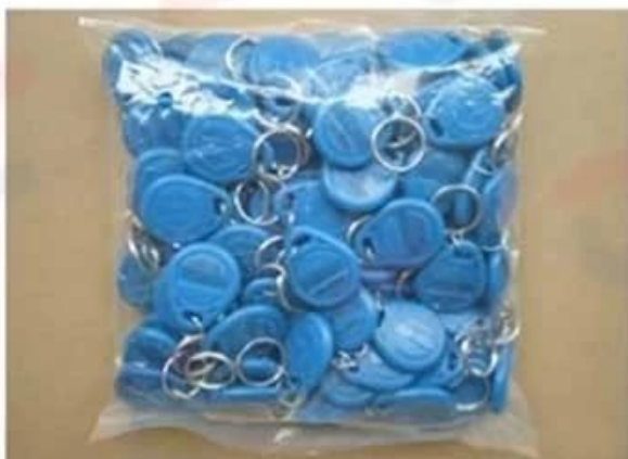
Default plastic bag (100 pcs/ bag)