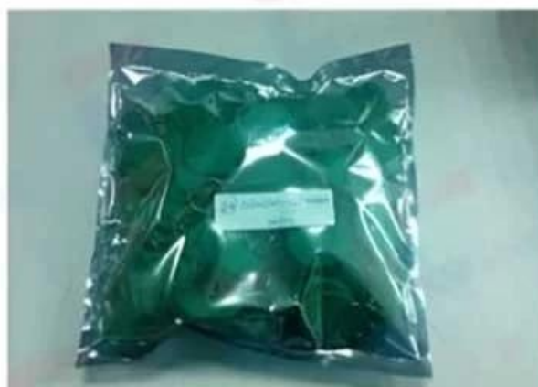
Antistatic bag (100 pcs/ bag)