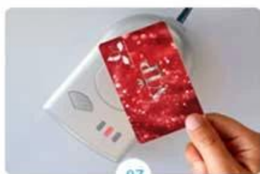
07 Pick-up cards