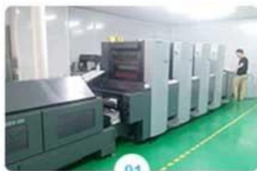
01 Heidelberg 4 color printer