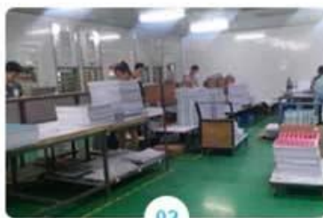
02 Laminating on machine