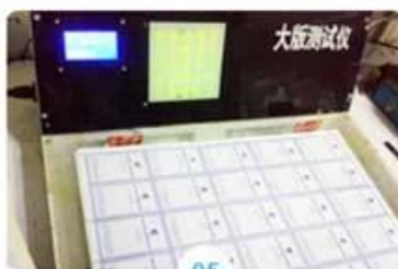
05 Pick-up whole sheet