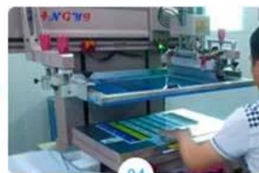
04 Silkscreen printing signature