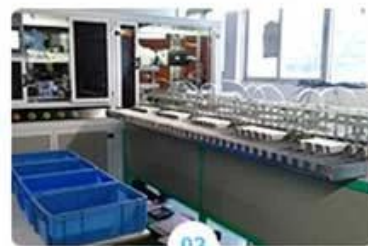
03 Automatic die-cut machine