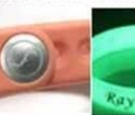
laser LOGO on lock