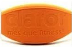
laser engraved no color