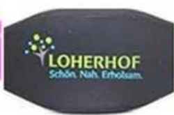
3 C silk screen printing