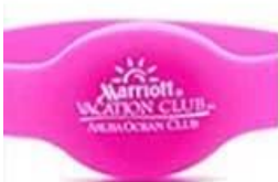
1 C silk screen printing