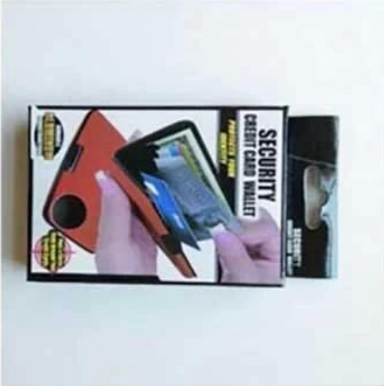
Custom printed box