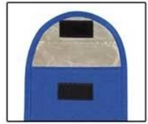
Conductive RFID Shielding Material