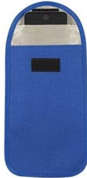
*Phone Not Included