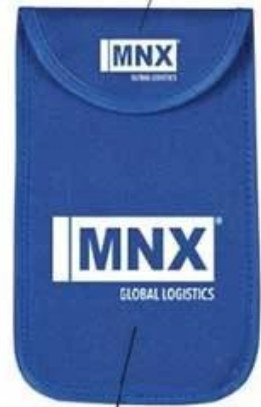
Optional Imprint Back