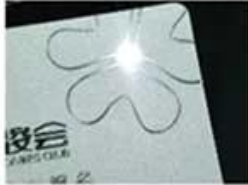
Silver Hot Stamping