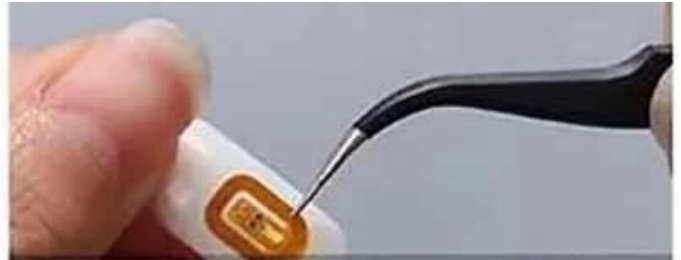
Step2 Put the sticker to wherever you like on the nail by tweezer. Make sure it is properly smooth.