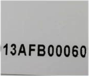
【 DOD Numbering 】