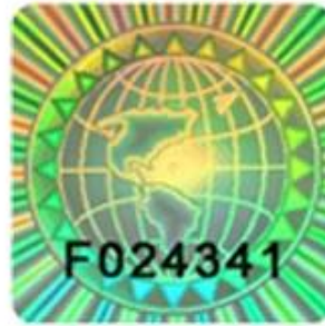
【 Hologram 】