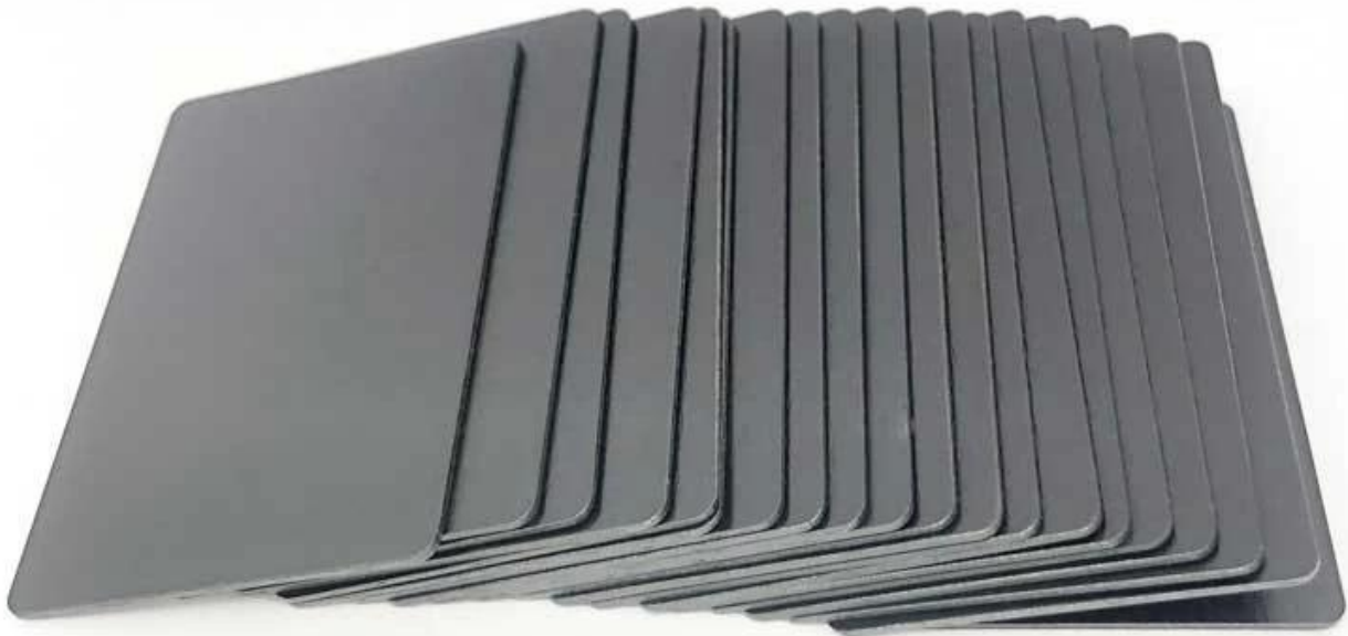
NFC Black Wooden Card