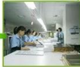
5.Printing sheets match up