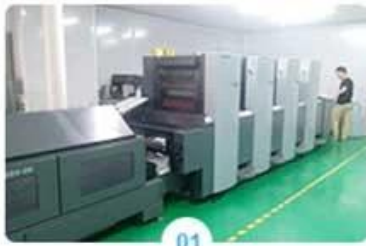
01 Heidelberg 4 color printer