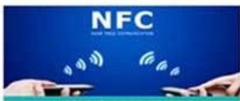
Data Exchange P2P