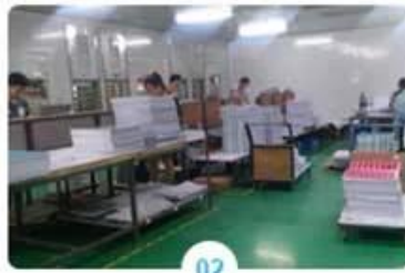
02 Laminating on machine