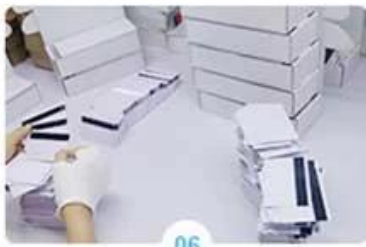
06 Pick-up cards