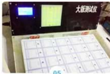
05 Pick-up whole sheet