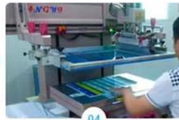
04 Silkscreen printing signature