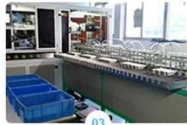
03 Automatic die-cut machine