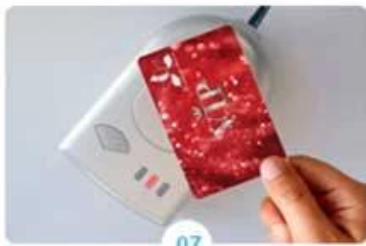
07 Pick-up cards