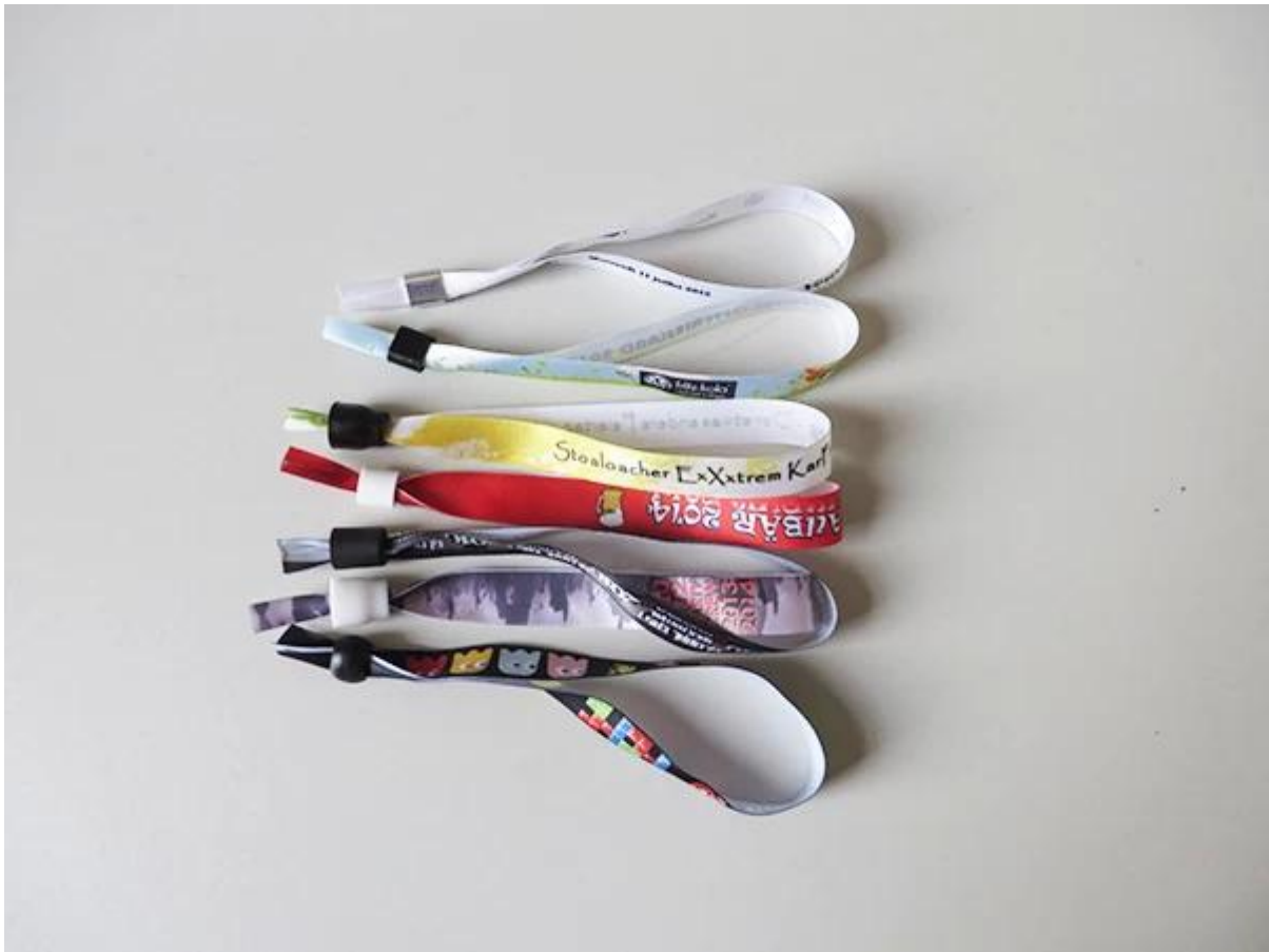
Flotex pour Bracelet tissé de tissu RFID