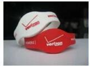
4.Silicone Wristbands (Full Sealed Type)