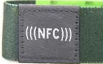
Four sides stitch