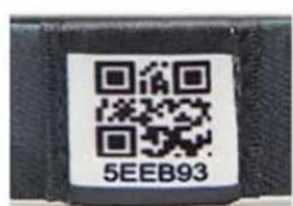
Unique QR code and number

Images détaillées du bracelet de sport RFID :