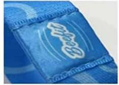
Thermal print logo