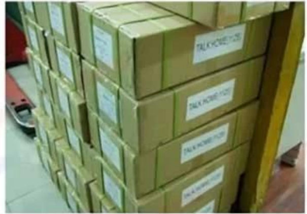
Outside Carton Package