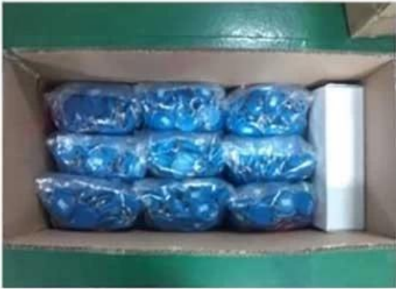
Inner Carton Package