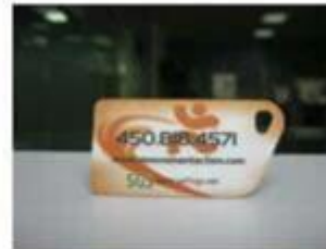
7. NFC PVC Tags