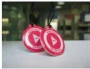
2.NFC Epoxy Tags