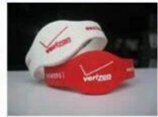
4.Silicone Wristbands (Full Sealed Type)