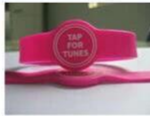
3.Silicone Wristbands (Adjustable Type )