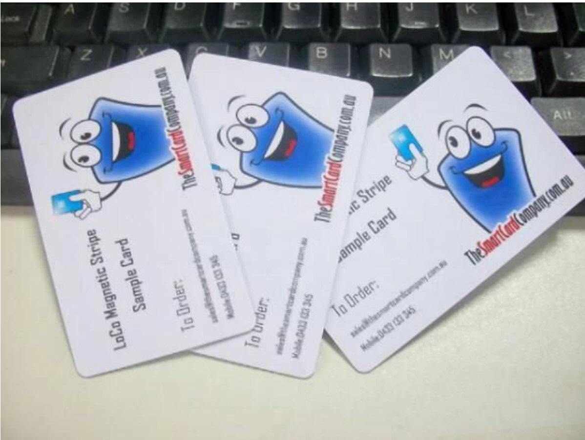
Autres produits de notre société