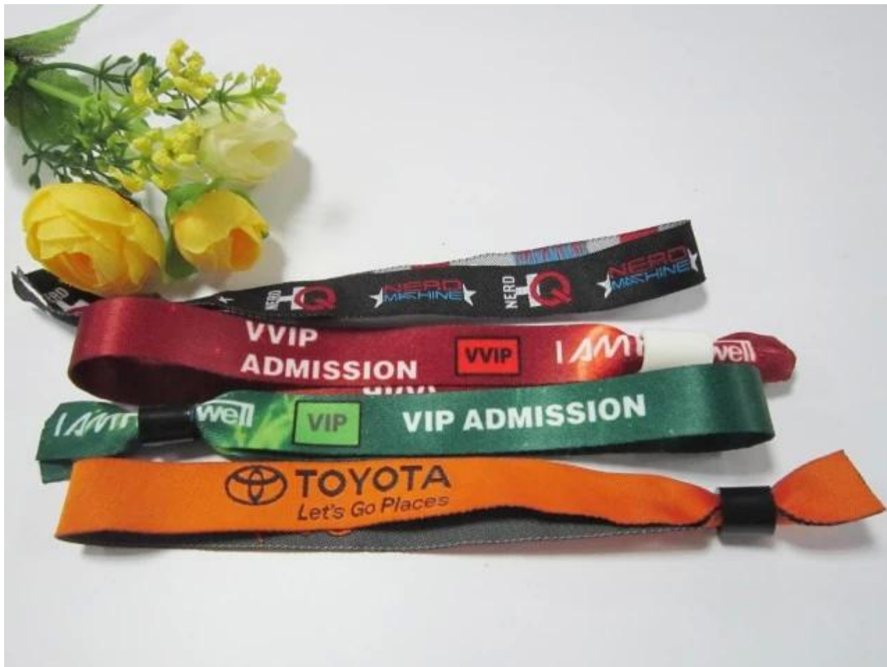
Processus de fabrication du bracelet tissé en tissu RFID