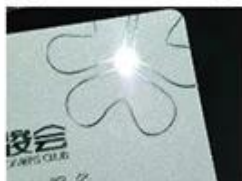
Silver Hot Stamping