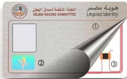
H. ① Pearlescent Color ② Anti-fake label ③ RFID Chip