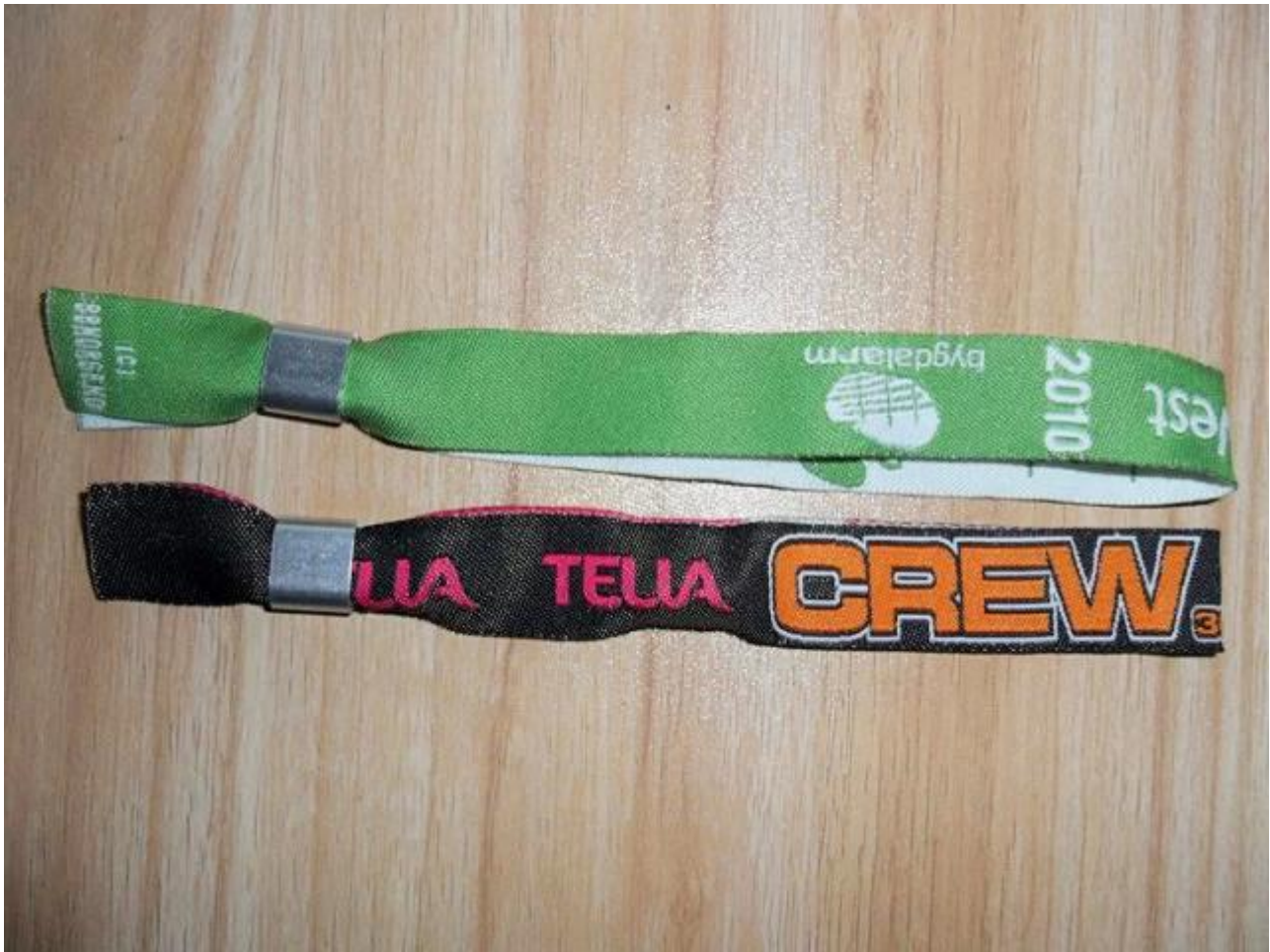
Flotex pour Bracelet tissé de tissu RFID