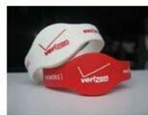
4. Silicone Wristbands (Full Sealed Type)