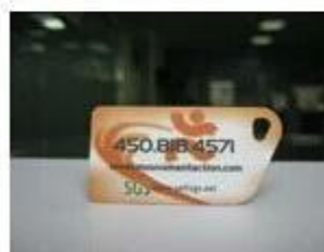
7. NFC PVC Tags