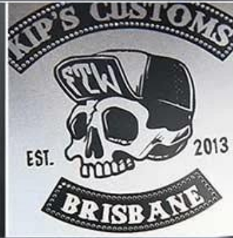
Spot color Printing