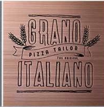
Etch with color infilling