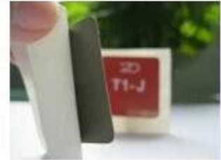
8. Anti-metal Stickers