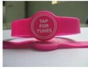
3.Silicone Wristbands (Adjustable Type )