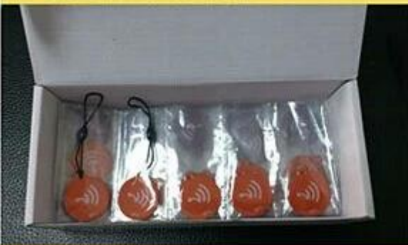
Package for Tags