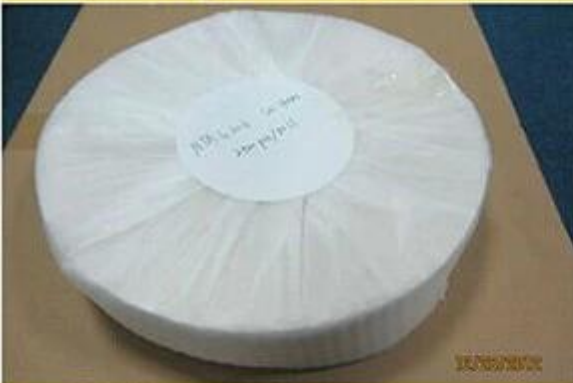
Stickers in Roll