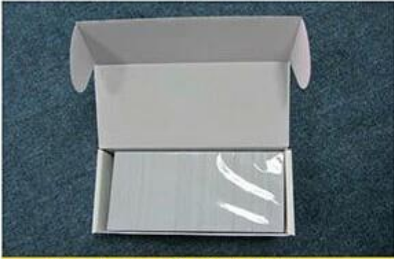
Package for Cards