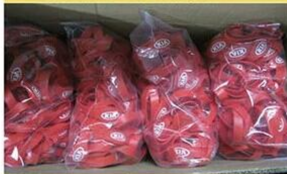
Package for Wristbands