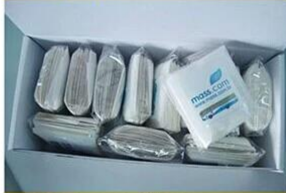
Stickers in Pieces