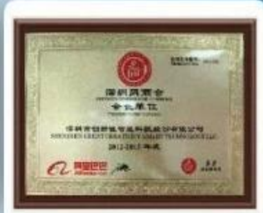
President Member Company of Shenzhen Chamber of E-Commerce