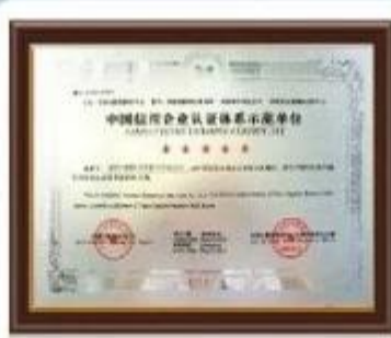
China Credit Example Certificate