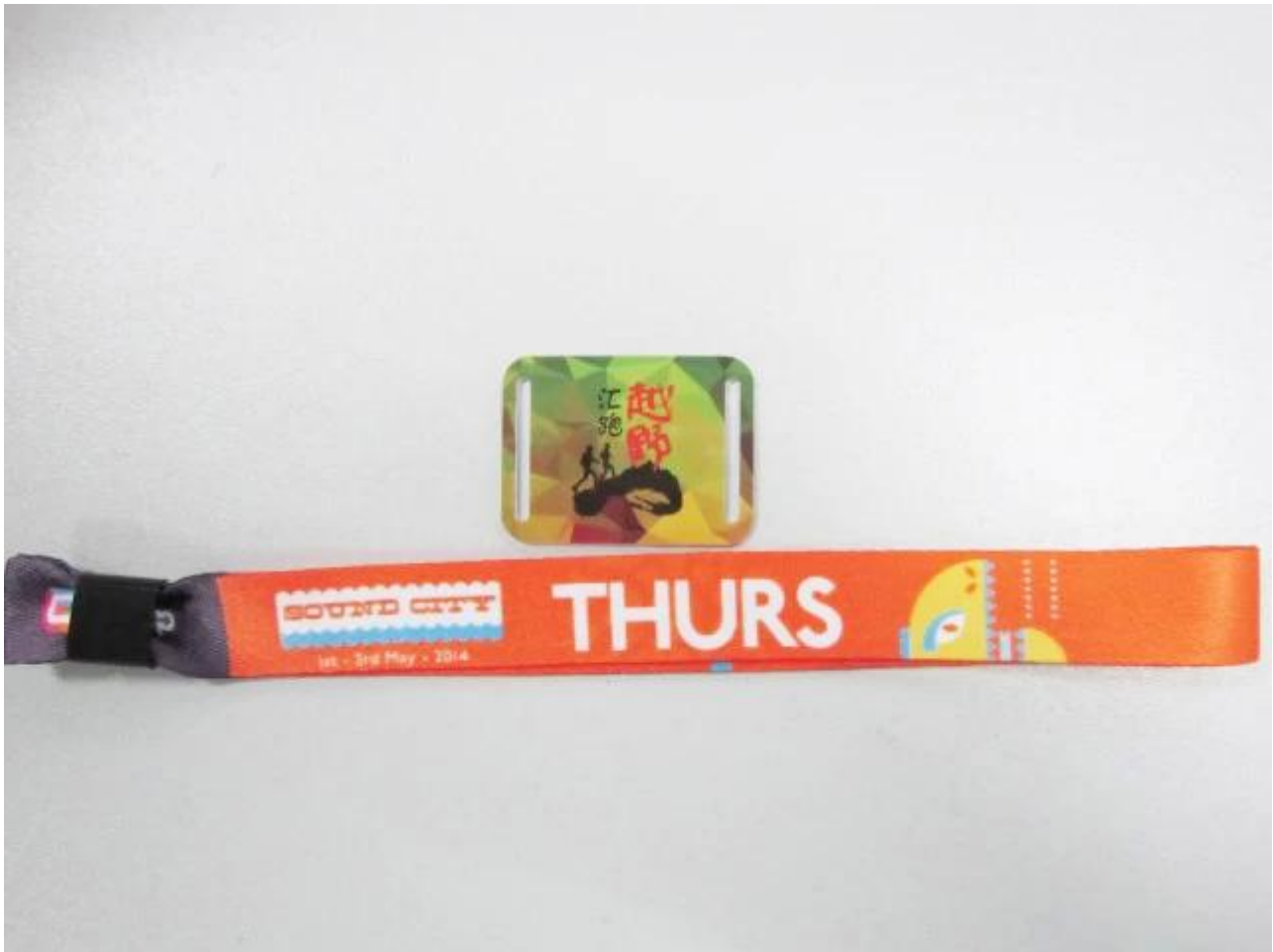
Flotex pour Bracelet tissu tissé