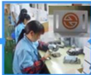
6.Testing & QC