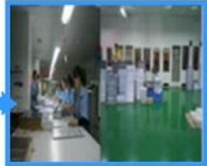
4.Matching & Compounding