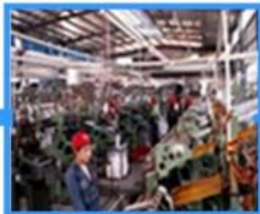
7.Fabric strip producing