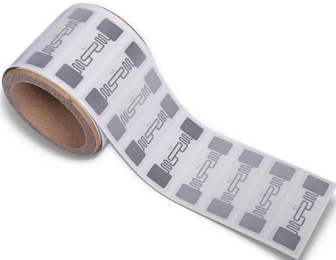
Photo de produit de 860 à 960mhz incrustation de humide rfid UHF

Colle les étiquettes RFID sont largement utilisés dans l'offre de gestion des marchandises, colis et les services postaux, logistique et système de gestion de stockage/entreposage, services de bibliothèque et location, étiquettes à bagages air, certification des produits, sécurité de marque, le système d'identification habituelles, étiquette de navire de pression et les autocollants de logistique d'autres autocollants de logistique de marchandises non métalliques.