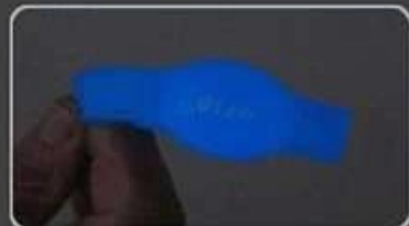
Glow in dark