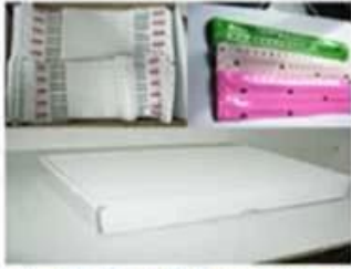
Package for Soft PVC/Paper Wristbands