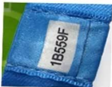
Unique serial number