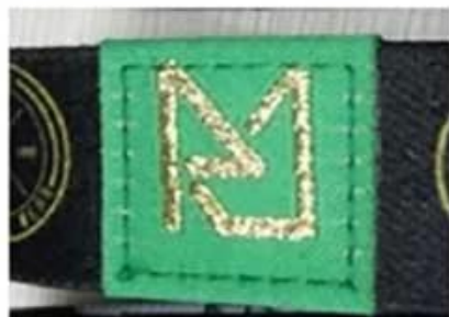
Gold woven logo