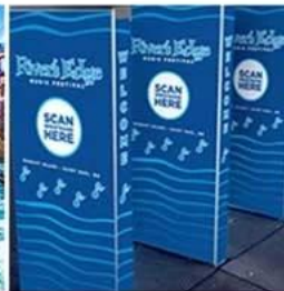
Exhibition & Conference