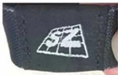
Two sides stitch