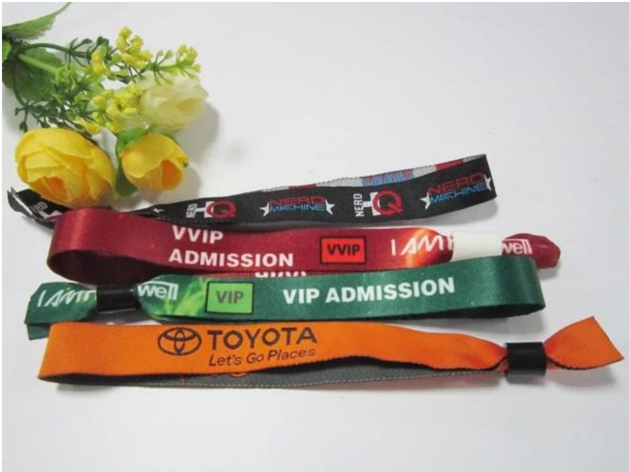
Proceso de producción de pulsera tejida de tela RFID