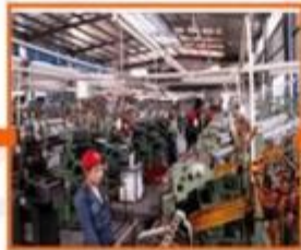
7. Fabric strip producing