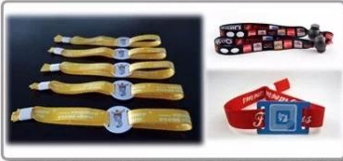
2. Waterproof paper /plastic wristband