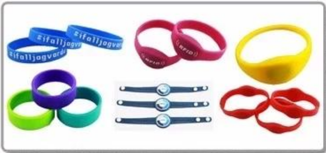
4. Silicone wristband-new type