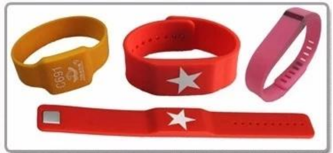
5. Silicone wristband-new type