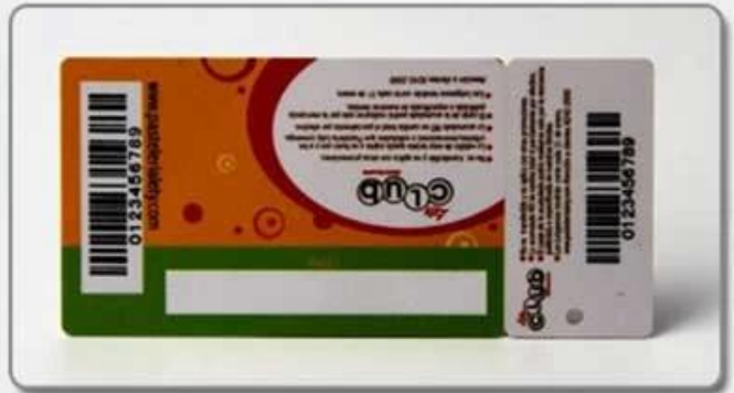
3. Comb card-style three