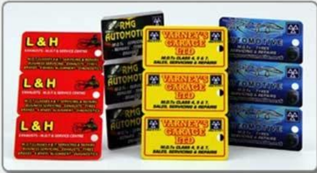
2. Comb card-style two