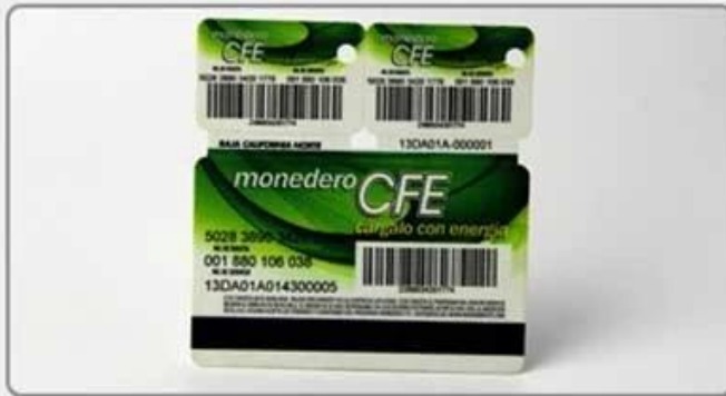
6. Comb card-style six