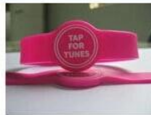
3.Silicone Wristbands (Adjustable Type )