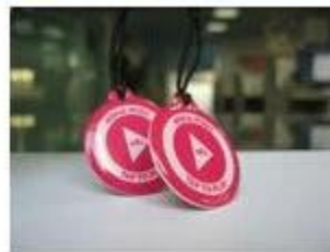
2.NFC Epoxy Tags