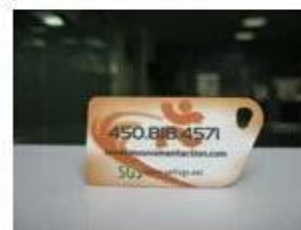
7. NFC PVC Tags