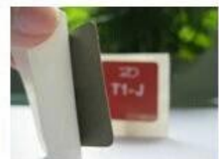
8. Anti-metal Stickers

Pulseras tejidas se hacen de tela y pueden ser producidas en color. Vienen con un cierre que