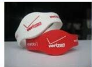
4.Silicone Wristbands (Full Sealed Type)