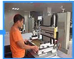
5.Film fabrication for printing