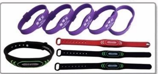
5. Silicone wristband-new type