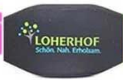
3 C silk screen printing