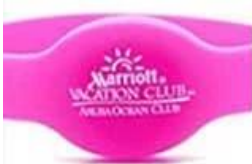
1 C silk screen printing