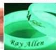
glow in dark