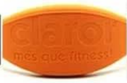
laser engraved no color