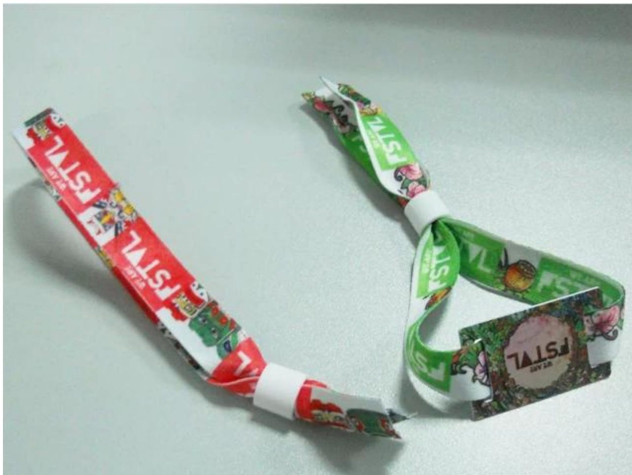
Proceso de producción de pulsera tejida de la tela RFID