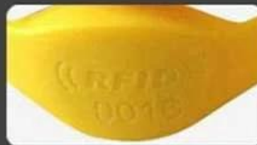
Laser UID number