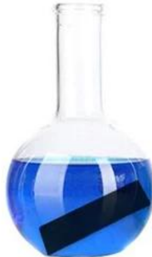
Alkali resistant laundry detergent