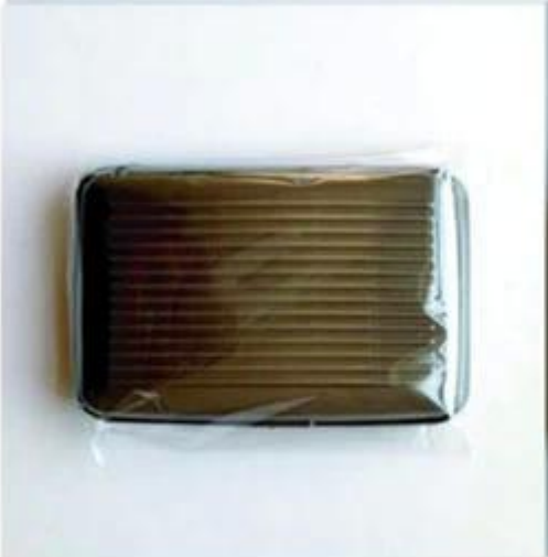
Normal opp bag