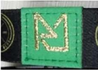
Gold woven logo