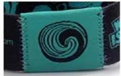
Z sides stitch