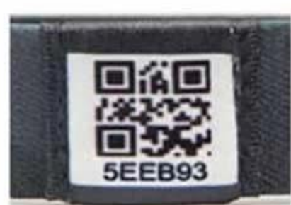
Unique QR code and number

Detaillierte Bilder des RFID-Sportarmbandes: