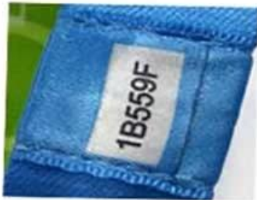
Unique serial number