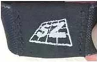
Two sides stitch