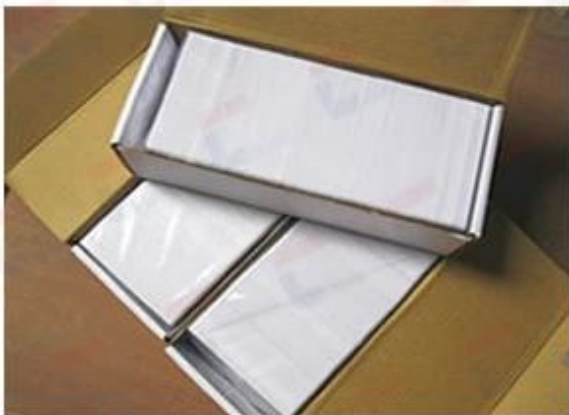
Inner Box Package