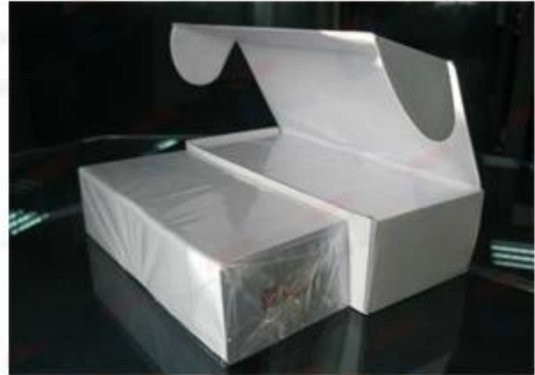
250/200 pcs Cards with Clear Paper