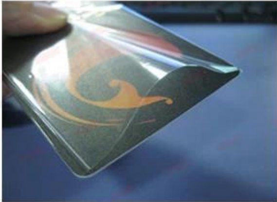
OPP Bag for Individual Card