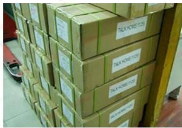
Outside Carton Package