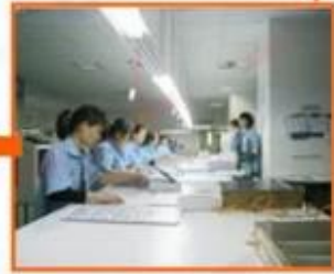
5.Print sheets matching