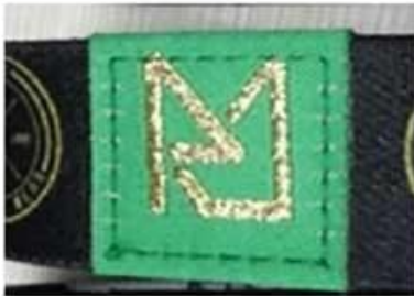
Gold woven logo