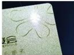
golden Hot Stamping