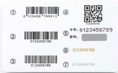
C. ① EAN 13 Barcode ② Code 128 ③ Code 39 ④ QR Code ⑤ Card NO. & PIN Code ⑥ Laser Code ⑦ Flat Code