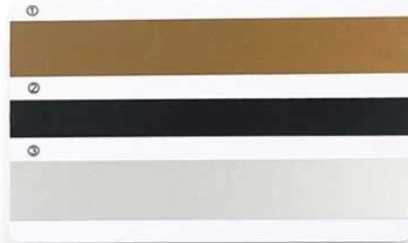
D. ① Gold Magnetic Stripe ② Black narrow Magnetic Stripe ③ Silver Magnetic Stripe