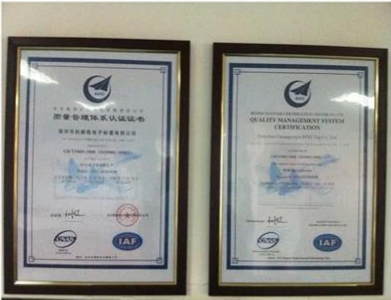
SGS Test Report

(80) MS reference to ISO 9001:2008, determination of Content of CP-080