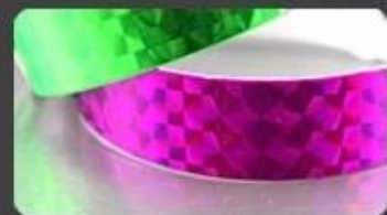
Sparkle straight wave