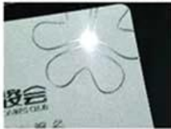
Silver Hot Stamping