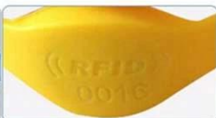
Laser UID number