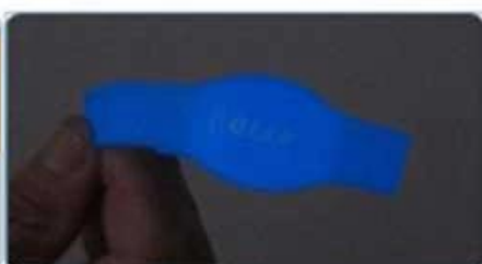
Glow in dark