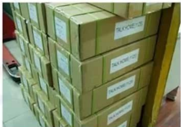
Outside Carton Package