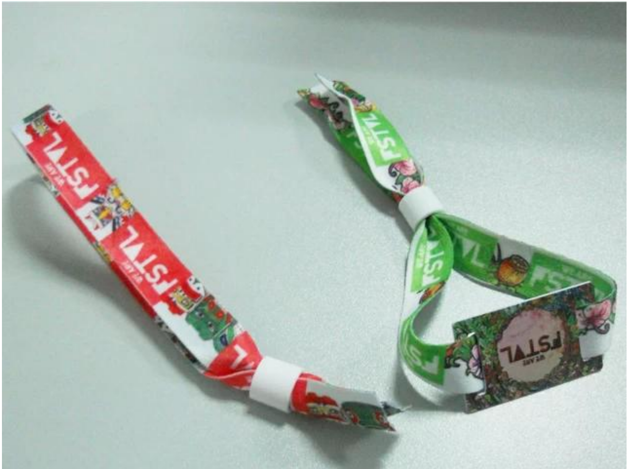
Herstellungsprozess von RFID-Stoff gewebtes Armband